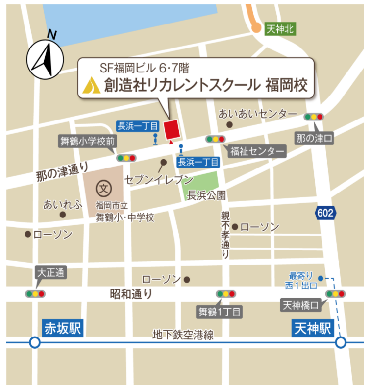
福岡市地下鉄 空港線 天神駅 西1出口から徒歩9分

※一定要件を満たせば、訓練期間中、職業訓練受講給付金(月10万円+通所手当)が支給されます。詳しくは、住所地を管轄するハローワークにお問い合わせください。