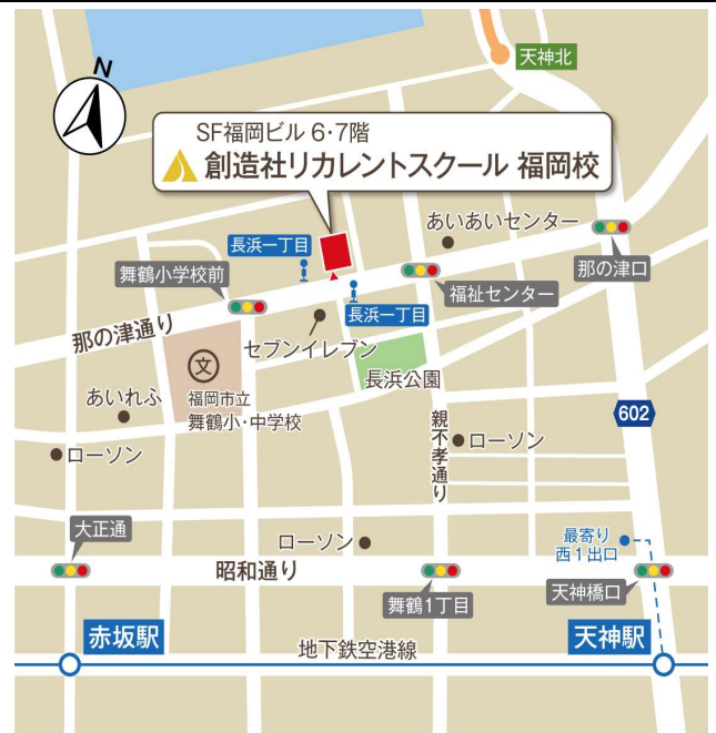
福岡市地下鉄 空港線 天神駅 西1出口から徒歩9分

※ 一定要件を満たせば、訓練期間中、職業訓練受講給付金(月10万円+通所手当)が支給されます。詳しくは、住所地を管轄するハローワークにお問い合わせください。